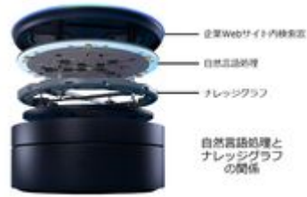
自然言語処理とナレッジグラフの関係